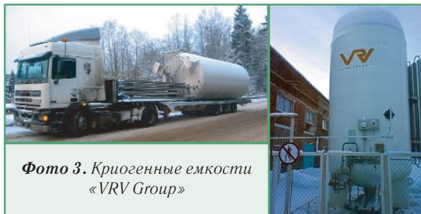
Фото 3. Криогенные емкости «VRV Group»