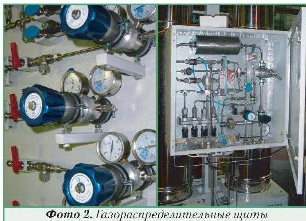
Фото 2. Газораспределительные щиты