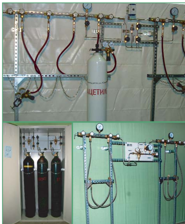
Фото 1. Примеры исполнения газоразрядных рампы

С использованием криогенного ёмкостного оборудования компании «VRV Group» создано более десятка систем газообеспечения предприятий техническими газами (фото 3).