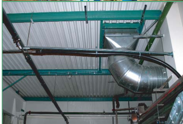
Фото 6. Монтаж гибкого криогенного трубопровода