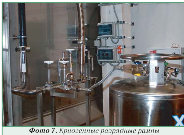
Фото 7. Криогенные разрядные рампы

Сепаратор газовой фазы расположен в верхней точке трубопровода и предназначен для отделения паров азота с целью гарантированной подачи только жидкой фазы в линии разлива напитков (фото 8).