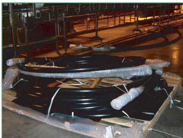
Фото 4. Гибкий трубопровод «Криофлекс-39/66» на монтажной площадке

менту использованных комплектующих и материалов работа для компании «Кока-Кола ЭйчБиСи Евразия». Проведено проектирование и монтаж криогенного трубопровода для подачи жидкого азота в две автоматические линии разлива напитков производства компании «Krones» (Германия). Подача жидкого азота производится с помощью гибкого трубопровода «Криофлекс 39/66» с вакуумной изоляцией производства компании «Nexans». Трубопровод состоит из шести секций длиной от 6,1 до 43,7 м (фото 4).