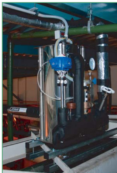
Фото 8. Криосепаратор газовой фазы

тора. Для повышения температуры газа он проходит через медный змеевик из трубки 6×1 мм. Управляющий электрический сигнал от датчика уровня преобразуется в пневмосигнал с помощью соленоидного клапана ЭПП компании «Samozzi» (Италия).